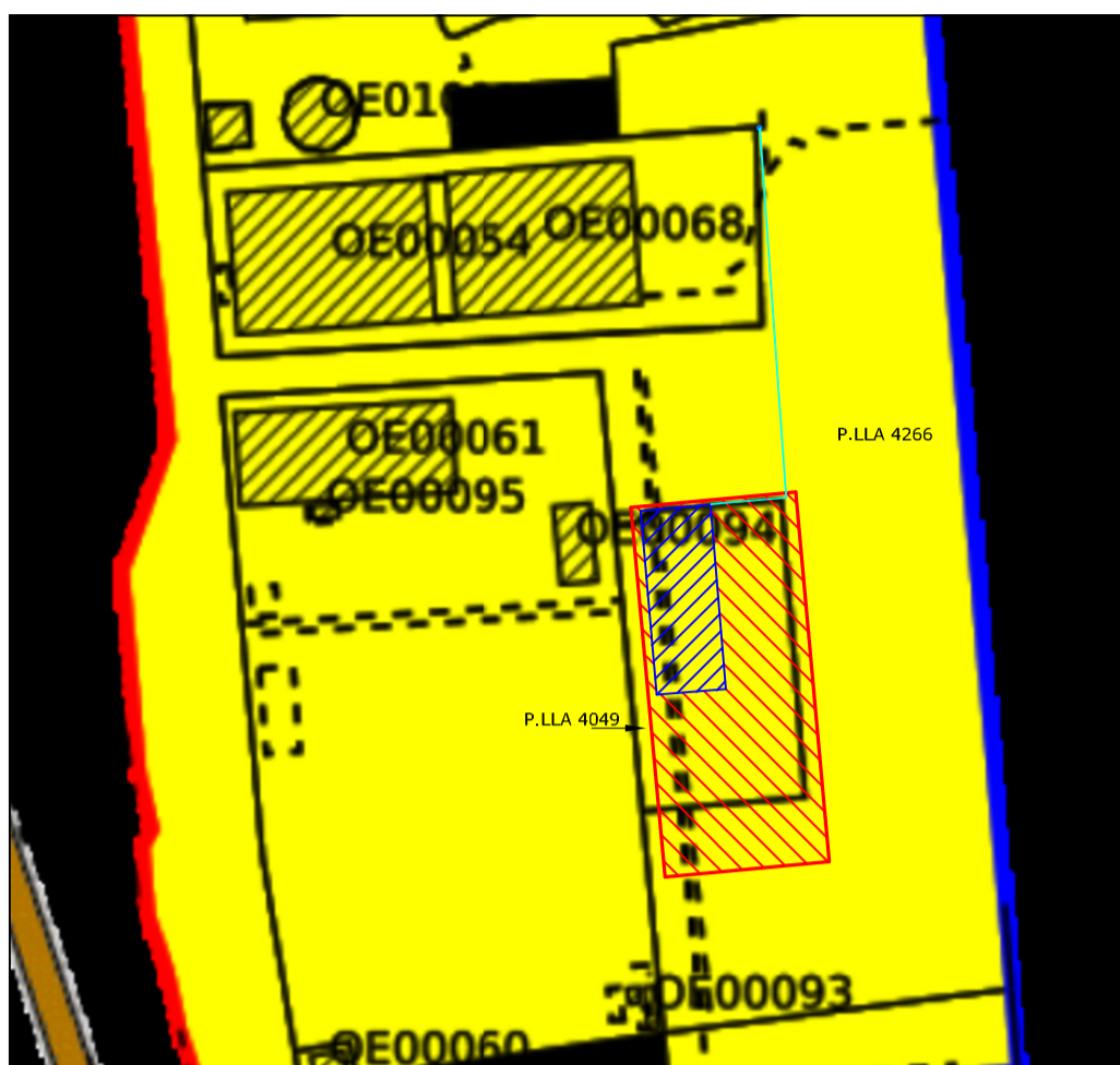
ESTRATTO DAL SID SCALA 1:2000